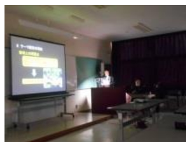
生徒の発表の様子