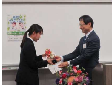
アイデア名は「埋もれている『鹿児島』をイノベーション」

大分大学経済学部主催のコンテストに養鶏研究班がエントリーし、1168 件の応募の中から見事、グランプリに輝きました。