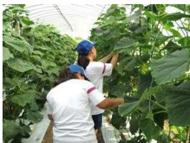
※詳細は公式ブログをご覧ください。

7月24日(月)～25日(火)の1泊2日で中学生の宿泊体験入学が実施されました。県内3校の中学校から6名の参加があり、遠いところは四国や沖永良部・屋久島などたくさんの中学生在校参加してくれました。本校3年生による学科説明、意見発表やプロジェクト発表を熱心に聞いていました。また、体験学習では、「フラワーアレンジ」「牛の見方とブラッシング」「情報処理」「ビンの中で食物を育てよう」「草花不思議なふやし方」「ピザ作り」「野菜の収穫」「ニワトリの飼育管理」「トラクタ運転」「すっぱい」を科学する「マドレーヌ作り」「フェルトペンケース作り」から希望の講座を体験しました。