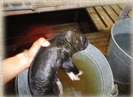
生まれたたての子豚です