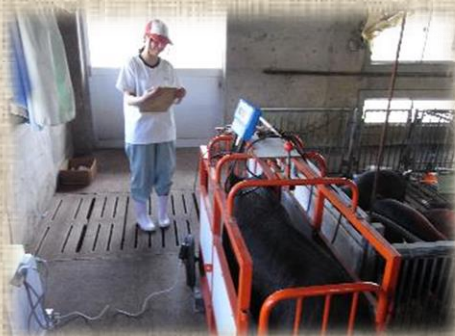
何キロになったかな？