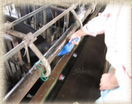
たくさん食べて大きくなってね！

豚の成長に合わせて餌の種類を変えています。健康に育て、良質な肉に仕上げるために重要です。