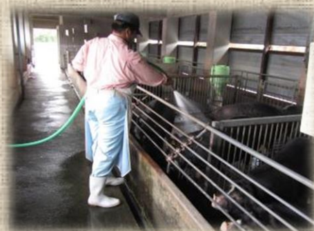
隅々まできれいに洗淨します！

飼育・衛生管理を徹底し、薬に頼らない、安心、安全かつ高品質な黒豚の生産に努めています！